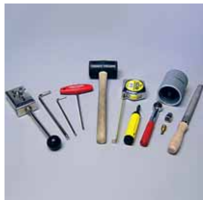
| CREFORM Werkzeuge