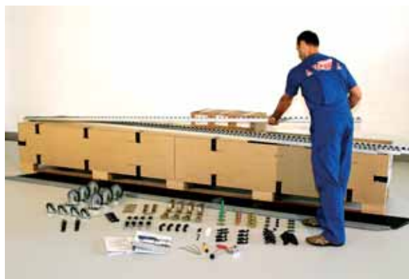
| CREFORM – Starter Kit