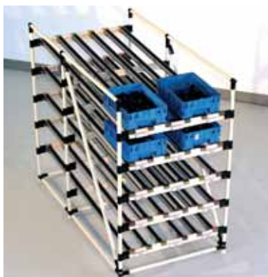
| FIFO Rack