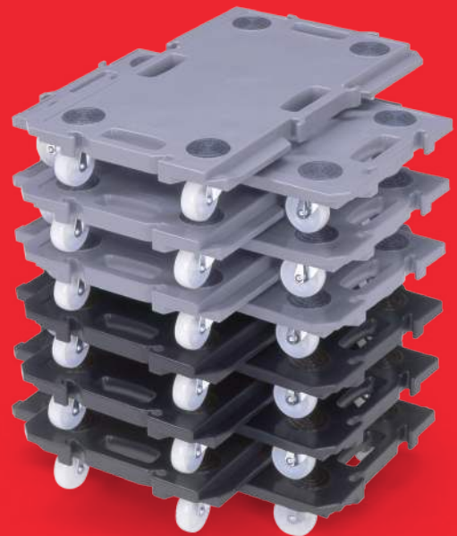
IM GESTAPELTEN LAGERN

Mit dem modularen Wagen der GN-Serie können Sie auf einfache Weise „Räder hinzufügen“. Wagen tragen nicht nur zum Transport von Behältern bei, sondern sorgen auch für einen sicheren und sauberen Arbeitsplatz, indem sie eine einfache und wendige Plattform bieten, um Behälter vom Boden fernzuhalten. Ein einzigartiges Merkmal des Wagendesigns ist seine Verriegelungsfähigkeit. Auf diese Weise können mehrere Wagen miteinander verbunden werden, um eine größere Plattform ohne Werkzeug zu schaffen. Das durchdachte Design ermöglicht auch das Stapeln für eine kompakte Lagerung.