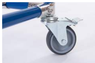
Räder und Rollen